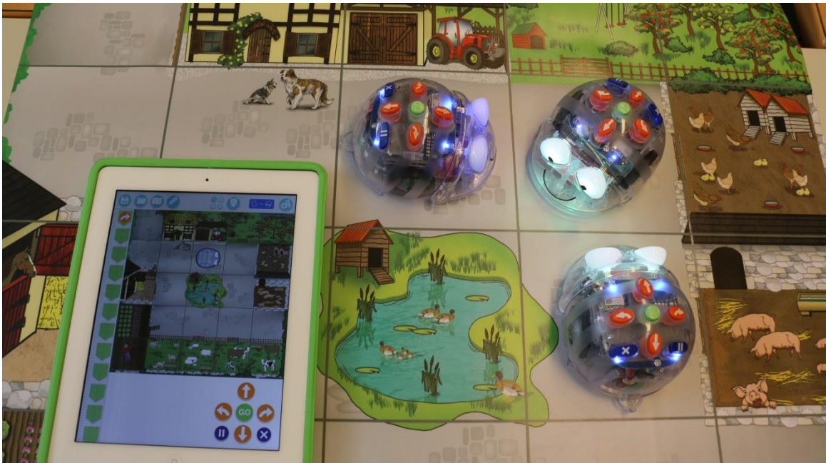
Illustration 1 : le Blue-Bot peut également être piloté avec un iPad

A l'école, le Blue-Bot peut être utilisé dans le cadre de plusieurs disciplines. Ainsi, en mathématiques, il peut servir à enseigner la pensée spatiale, à expliquer le système de coordonnées, à visualiser des figures géométriques simples ou à résoudre des exercices de calcul. Dans le domaine préscolaire, il peut être employé pour apprendre à compter ou pour découvrir de nouveaux mots. Les exemples cités ne sont que quelques-unes des nombreuses possibilités. Grâce à ces robots, on peut aussi développer les compétences personnelles, sociales et méthodologiques. Par groupes de deux élèves ou plus, l'élaboration progressive de solutions est favorisée au moyen de conseils mutuels et de discussions.