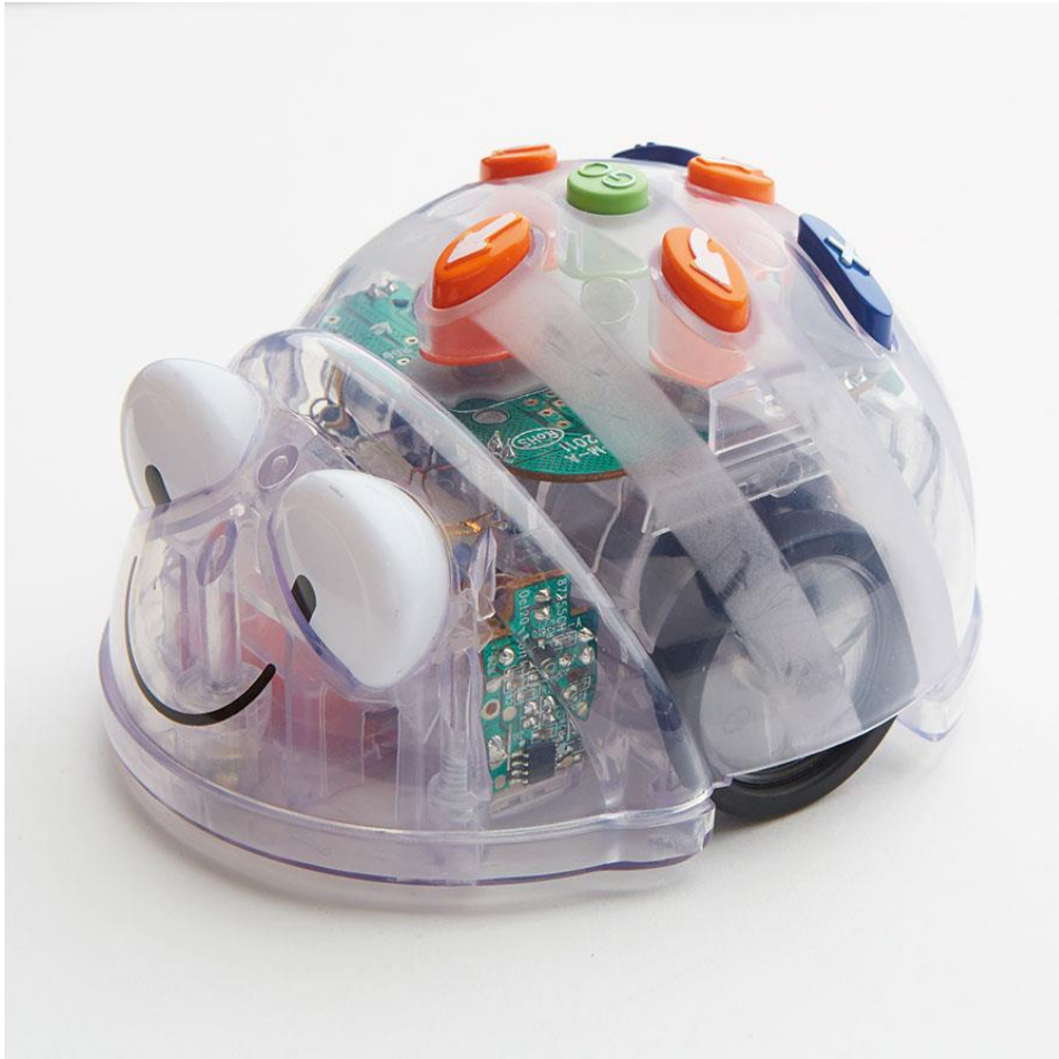
Illustration 2 : le Blue-Bot

En principe, la présentation technique peut être courte afin de laisser aux élèves l'occasion d'explorer eux-mêmes les fonctionnalités de l'appareil. Un petit jeu de simulation convient en guise d'introduction à la programmation. On bande les yeux à un élève qui joue le rôle du robot. Un autre incarne le programmeur : il donne des instructions concrètes au robot qui devra les exécuter le plus précisément possible. Exemple : « fais deux pas en avant » ou « tourne-toi vers la droite ». Il est ainsi possible de guider le robot à travers un parcours en slalom ou jalonné d'obstacles.